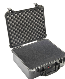
1550WF With Foam