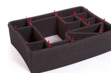
1550EUTP Kit divisorio per valigie TrekPak